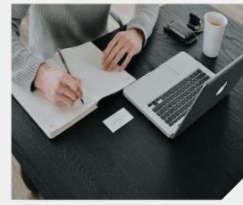
각종 서류 준비