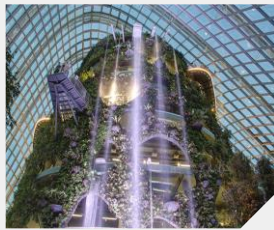
유명 관광지 포함