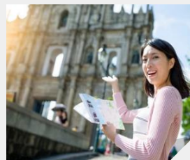
전문 인솔자 동행